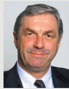
François Sauvadet Membre du Bureau Ancien Ministre Président du Conseil départemental