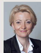
Laurence Porte Conseillère départementale du canton de Montbard