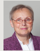
Martine Eap-Dupin Conseillère départementale du canton de Semur-en-Auxois