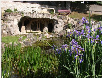
La grotte de rocaille

une grotte de rocaille et, à l'extrémité est, un joli pavillon avec tour.