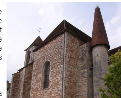
Église de Morey-Saint-Denis

2 Poursuivre tout droit jusqu'au parking.