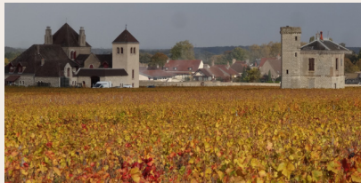
Château de la Tour