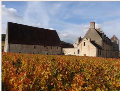
Clos de Vougeot